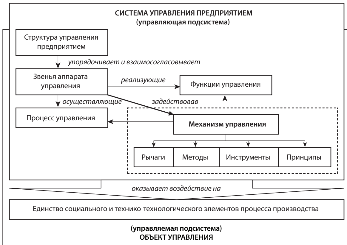
Рис. 2. Механизм управления как элемент системы управления предприятием

Неотъемлемым элементом механизма управления являются принципы управления, определяющие его качественное содержание. Наряду с общими принципами управления, разработанными школой научного менеджмента и класси-