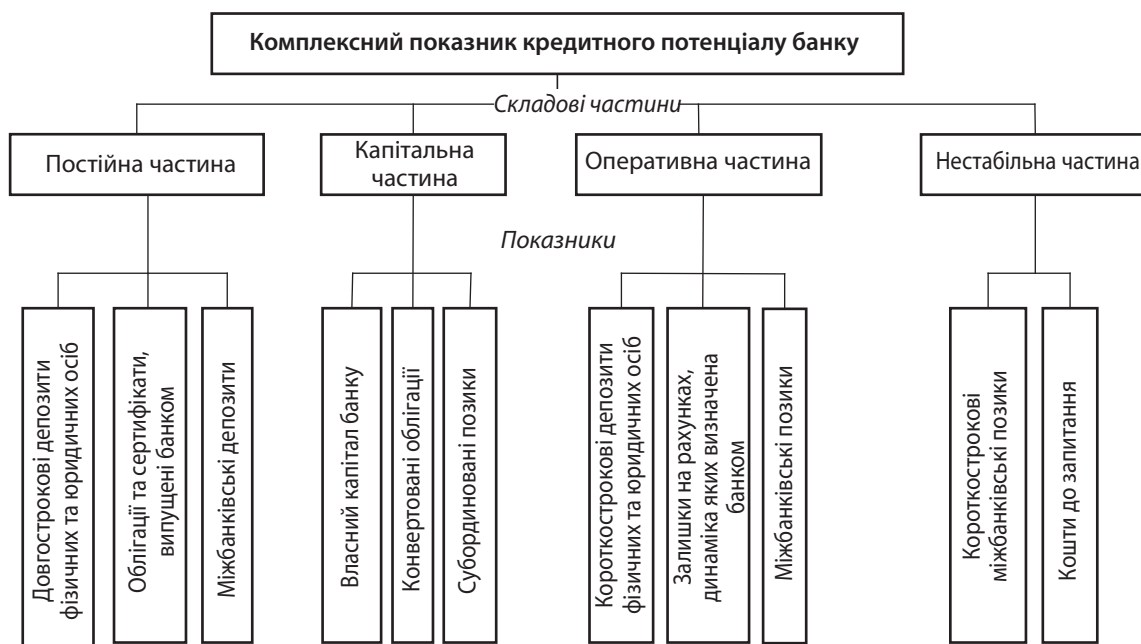
Рис. 1. Структура комплексного показника кредитного потенціалу банку

Стандартизовану оцінку \chi -ої складової показника кредитного потенціалу i -го банку пропонується визначати методом відносних різниць, який дозволяє стандартизувати різномасштабні змінні на основі формул (2 та 3) [18]: