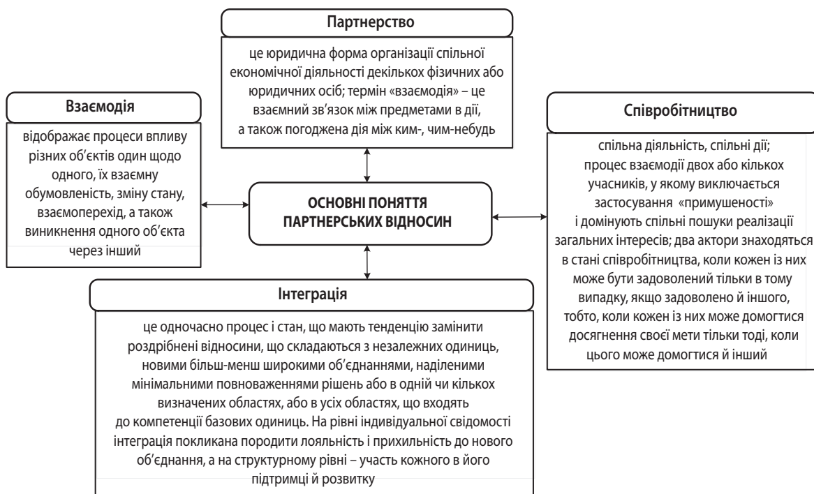
Рис. 2. Основні поняття, що розкривають зміст партнерських відносин

В етимологічному словнику української мови зазначено, що слово «партнер» в українську мову запозичене із французької, у свою чергу, французьке «partenaire» походить від англійського «partner», яке має кілька значень, зокрема, «співспадкоємець», «поділ», «частина» тощо [15]. Партнерство в сучасному розумінні – це вид взаємин між різними суб'єктами, який полягає у формуванні єдиної позиції з певних питань та організації спільних дій. Специфікою партнерства є збереження кожним з партнерів відносної самостійності в основних аспектах діяльності. Тож партнерство як вид спільної діяльності полягає в рівноправності її учасників, що передбачає рівні права й обов'язки кожної зі сторін, а відтак і взаємну відповідальність. Отже, партнерство – це ідеальний варіант стосунків рівноправних суб'єктів, які усвідомлюють значення своїх дій для партнера і свою діяльність будують так, щоб виправдати сподівання партнера і досягти спільної мети. Партнерство можливе лише за умови взаємної довіри,