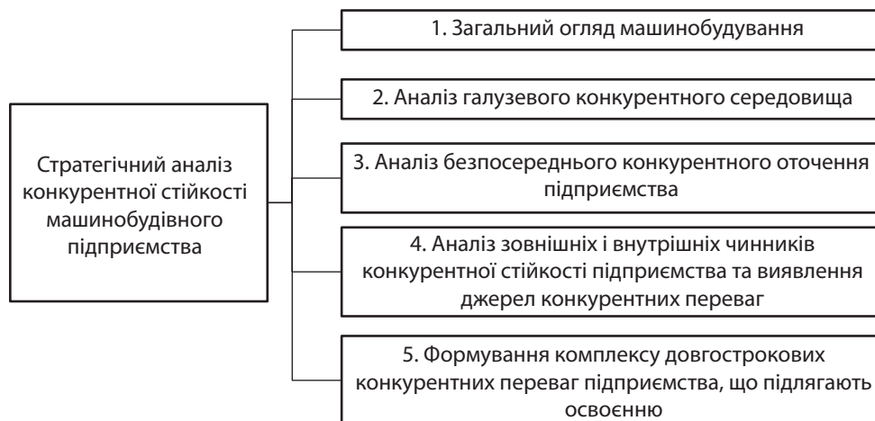
Рис. 2. Складові стратегічного аналізу конкурентної стійкості машинобудівного підприємства

Важливим напрямом аналізу галузевого конкурентного середовища є стратегічна сегментація конкурентів на ринку машинобудування, що дозволяє виділити стратегічні групи конкурентів.