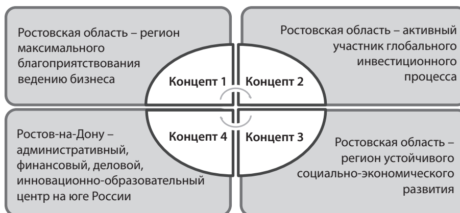
Рис. 2. Концепты государственной политики развития инвестиционной сферы Ростовской области

2. Борьба с административными барьерами – оптимизация сроков, порядка прохождения и обеспечения прозрачности различных процедур согласования инвестиционного проекта, дальнейшая реализация принципа «одного окна» в целях исключения или минимизации участия пред-