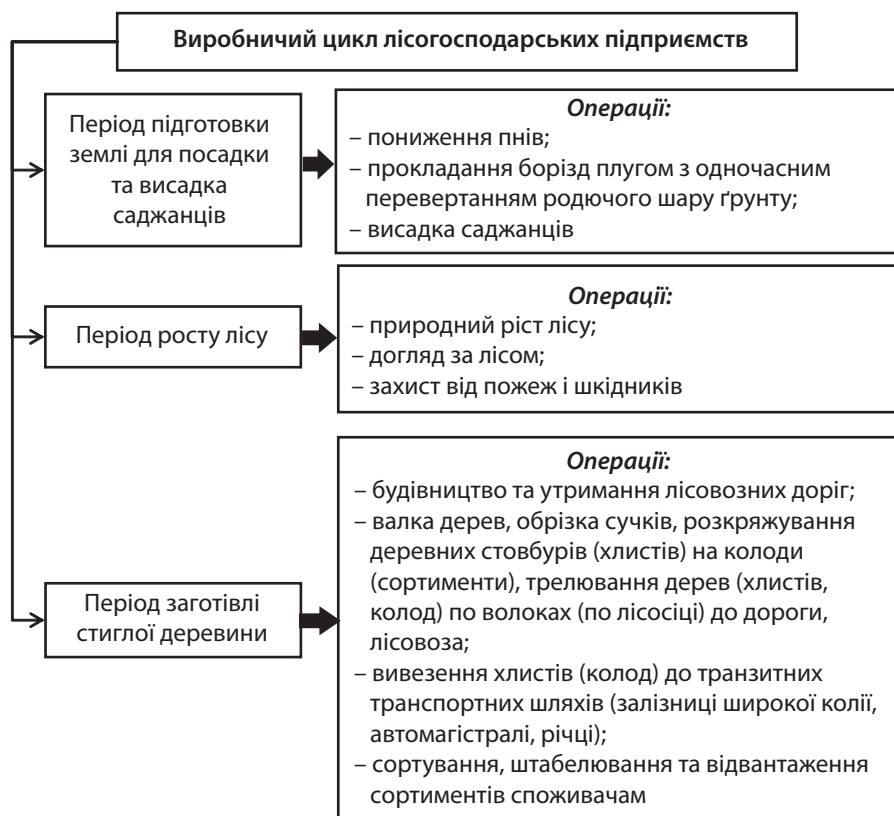
Рис. 1. Виробничий цикл лісгосподарських підприємств

5. Різноманітність продукції. Ліс багатий на флору і фауну. Ліс – це джерело деревини, ягід, горіхів, грибів, плодів дикорослих рослин, лікарських рослин та інших лісових продуктів, а також це домівка для багатьох видів тварин і комах.