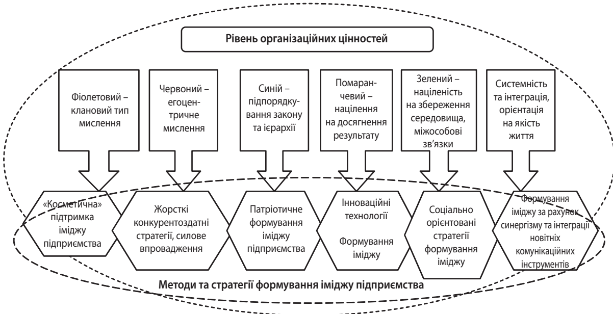
Рис. 2. Формування іміджу підприємства на основі теорії спіральної динаміки

Слід зазначити, що теорія спіральної динаміки передбачає розгляд як зовнішнього середовища, так і внутрішнього управління цінностями компанії. У випадку, коли на підприємстві домінує помаранчевий тип, доцільно застосовувати до управління економічну мотивацію. Якщо домінує зелений тип – необхідно базуватися на принципі участі та досягненні консенсусу. Однак недоліком обох підходів є нерозуміння, як поводитися з іншими типами працівників підприємства.