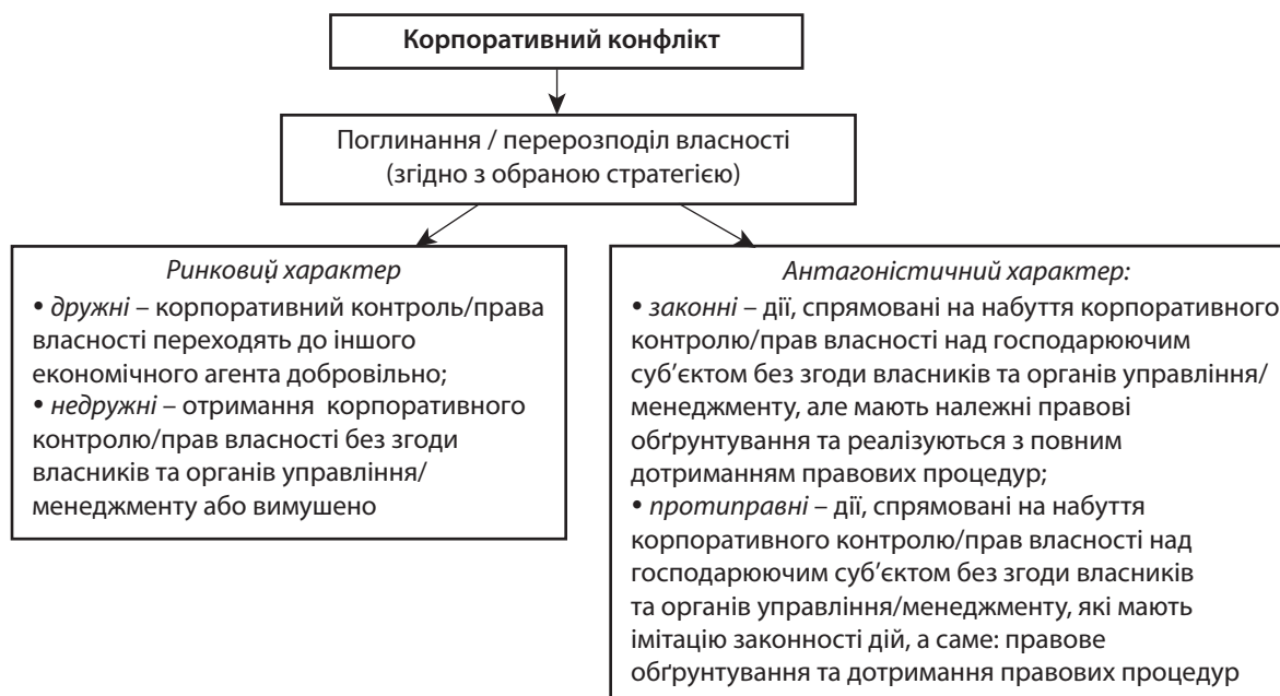
Рис. 1. Шляхи перерозподілу власності, в основі якого є риси корпоративного конфлікту

Сам Закон України «Про акціонерні товариства», що повинен був захистити права власників незалежно від розміру частки в капіталі, був прийнятий лише в 2008 р., до цього його впродовж восьми років сім разів було відхилено українськими парламентарями. Це були різноманітні варіанти законопроекту, де в основі лежав розроблений ще восени 1998 р.і закон «Про акціонерні товариства», підготовлений професорами Б. Блеком і Г. Тарасавою.