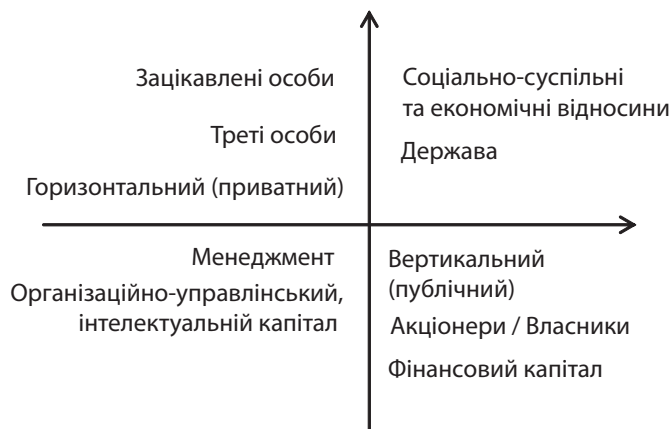
Рис. 2. Основні учасники та інтереси корпоративного конфлікту

Відтак, можна розмістити учасників відповідно до їх цілей. Наприклад, рейдери та конкуренти діють у забезпечення приватних інтересів, але їх дії публічні та зазвичай носять резонансний характер. Вертикально-публічні конфлікти мають на меті захист своїх прав і відносяться до держави, кредиторів та інших зацікавлених осіб, але вони частіше стають жертвами (рис. 2).