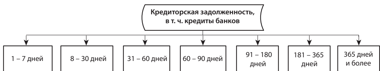
Рис. 6. Группы кредитов банков и кредиторской задолженности по срокам до погашения

Управление финансовой моделью происходит путем определения величины изменения отдельных составляющих капитала под воздействием факторов риска, которые были выявлены на первом этапе.