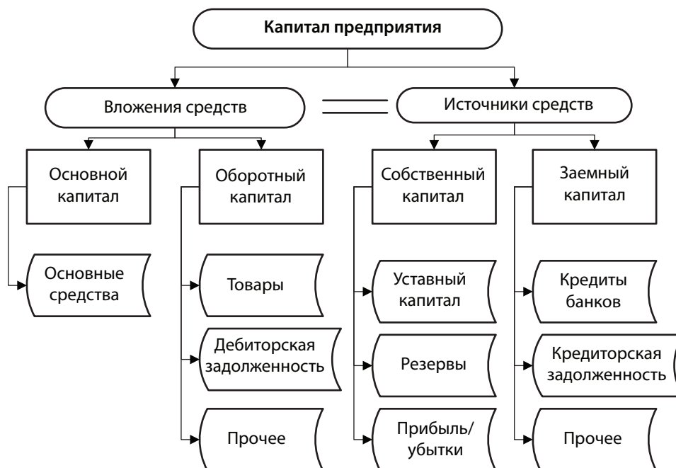
Рис. 3. Финансовая модель структуры капитала предприятия

четом суммы износа на дату оценки, для других основных средств – современная себестоимость приобретения за вычетом суммы износа на дату оценки. Для упрощения процедуры в финансовой модели возможно использовать в качестве справедливой стоимости основных средств себестоимость приобретения за вычетом суммы износа. Оборотный капитал представлен наиболее характерными для торгового предприятия активами, такими как товар и дебиторская задолженность. Товар целесообразно группировать по степени ликвидности, то есть способности быть быстро проданным по цене, близкой к рыночной (рис. 4).