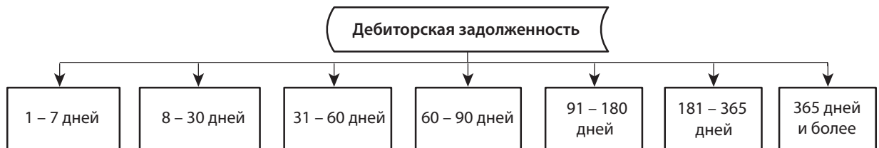
Рис. 5. Группы дебиторской задолженности по срокам до погашения

ности необходимо учитывать это влияние. Поэтому в модели целесообразно стоимость дебиторской задолженности корректировать на уровень резервирования ( Provisions rate (PR) ), который определяется как размер (%) невозврата дебиторской задолженности и рассчитывается на основании данных о вероятности дефолта контрагентов ( Probability of default (PD) ) и уровня возможных потерь при дефолте контрагентов ( Loss given default (LGD) ). Уровень резервирования предлагаем определять для групп дебиторской задолженности, сформированных по ряду критериев, среди которых могут быть следующие: покупатели/поставщики в разрезе групп товаров; покупатели/поставщики в разрезе величины бизнеса (микропредприятие, малое предприятие, среднее предприятие, большое предприятие (критерии отнесения в соответствии с Хозяйственным кодексом Украины)); покупатели/поставщики в разрезе периода функционирования (менее 1 года, 1 – 3 года, 3 – 5 лет, 5 – 10 лет, более 10 лет). Для определения уровня резервирования ( PR ) необходимо провести анализ дебиторской задолженности предприятия (в разрезе групп ( i )) за продолжительный период времени (3 – 5 лет). Расчет уровня резервирования ( PR ) по каждой группе дебиторской задолженности на отчетную дату осуществляется по формуле (1):