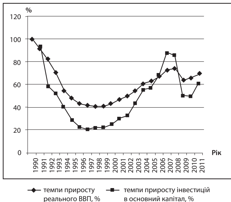
Рис. 1. Темпи приросту реального ВВП та інвестицій в основний капітал (відсотків до 1990 р.) в Україні у 1990 – 2011 рр.

На основі порівняння темпів приросту реального ВВП та інвестицій в основний капітал можна припустити, що ці показники взаємопов'язані, зокрема на рис. 1 видно, що їх зростання та падіння на однакових часових відрізках співпадають. З'ясуємо наявність залежності та характер зв'язку між темпами приросту реального ВВП та інвестицій в основний капітал (рис. 2).