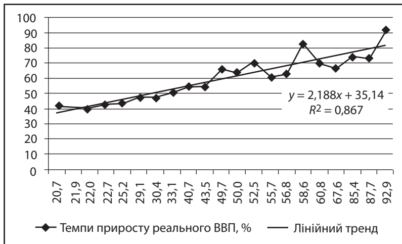
Рис. 2. Залежність темпів приросту реального ВВП від темпів приросту інвестицій в основний капітал в Україні