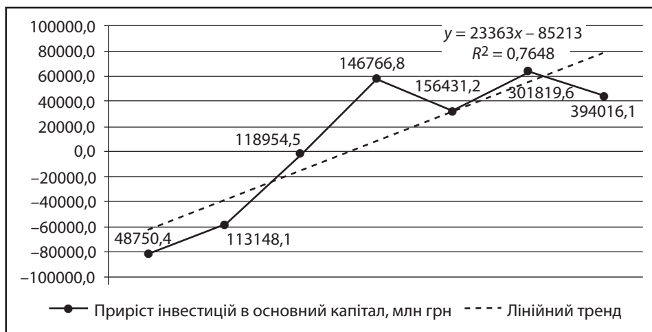
Рис. 4. Залежність приросту інвестицій в основний капітал від приросту активів, акумульованих фінансовими посередниками в Україні

На тлі помірної інвестиційної політики недержавних пенсійних фондів і страхових компаній варто відзначити значний контраст у цьому питанні з інститутами спільного інвестування. Оскільки, як уже зазначалося вище, ІСІ у першу чергу націлені на отримання прибутку, а тому формують власний інвестиційний портфель за рахунок більш ризикових фінансових інструментів. Таким чином, існують значні диспропорції в розвитку різних інститутів фінансового посередництва, зокрема банківський сектор, на відміну від небанківського, поки займає ключове місце на вітчизняному фінансовому ринку. Потенційну здатність всіх фінансових посередників оцінимо за допомогою економіко-математичного моделювання (рис. 4).