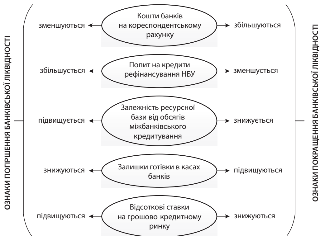
Рис. 3. Ознаки змін стану ліквідності банківської системи

Загалом же банківська ліквідність характеризується постійними змінами. Ці зміни, що відбуваються в стані ліквідності банківської системи, мають зовнішні ознаки [5, с. 13], основні з яких узагальнено та наведено на рис. 3.