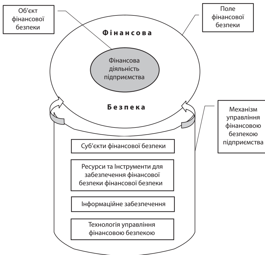
Рис.3. Модель підсистеми фінансової безпеки підприємства

По-третє, процес забезпечення фінансової безпеки має бути безперервним, оскільки лише за таких умов стає можливим використовувати технології управління фінансовою безпекою підприємства, побудовані на принципах превентивності.