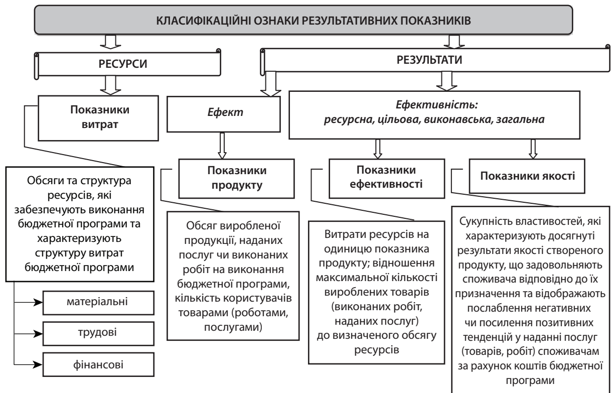
Рис. 1. Класифікаційні ознаки результативних показників бюджетних програм

На рис. 3 проілюстровано показники якості наведеної вище програми.