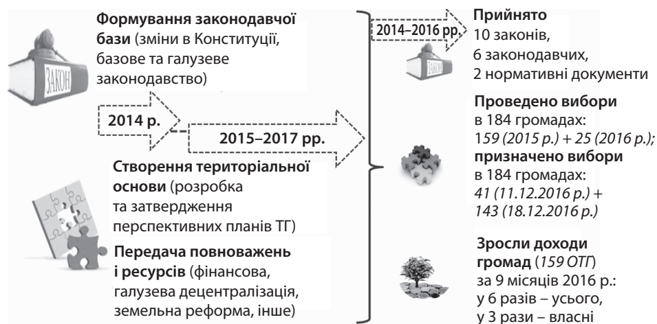
Рис. 2. Етапи реалізації реформи децентралізації в Україні