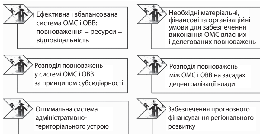
Рис. 1. Основні завдання реформи децентралізації

Адміністративно-організаційні засади реформи децентралізації частково реалізовані законами України