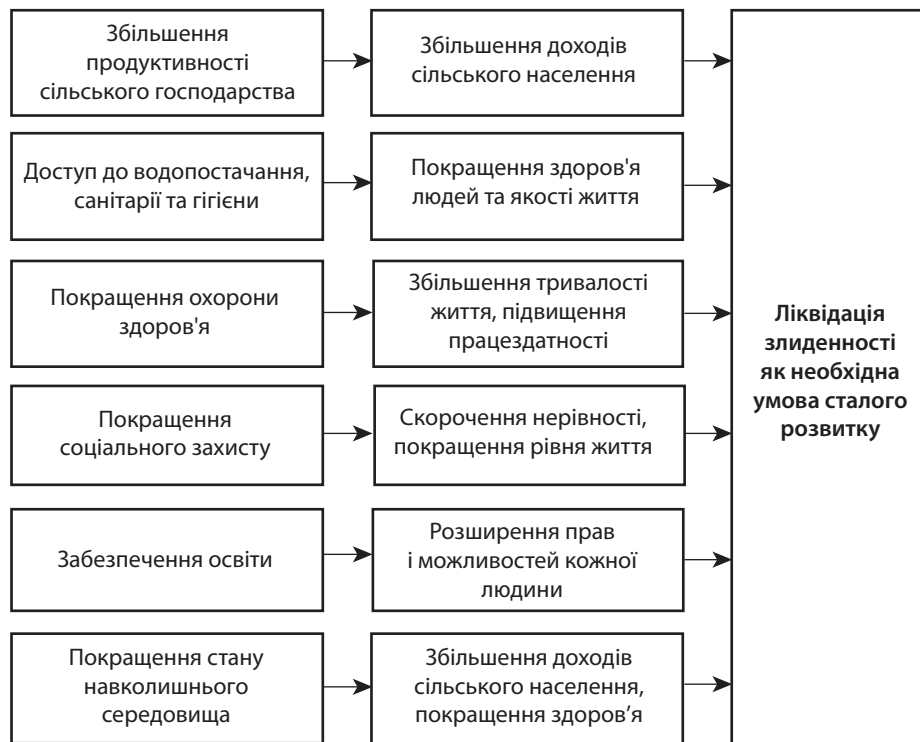
Рис. 2. Пріоритетні заходи у сфері ліквідації злиденності