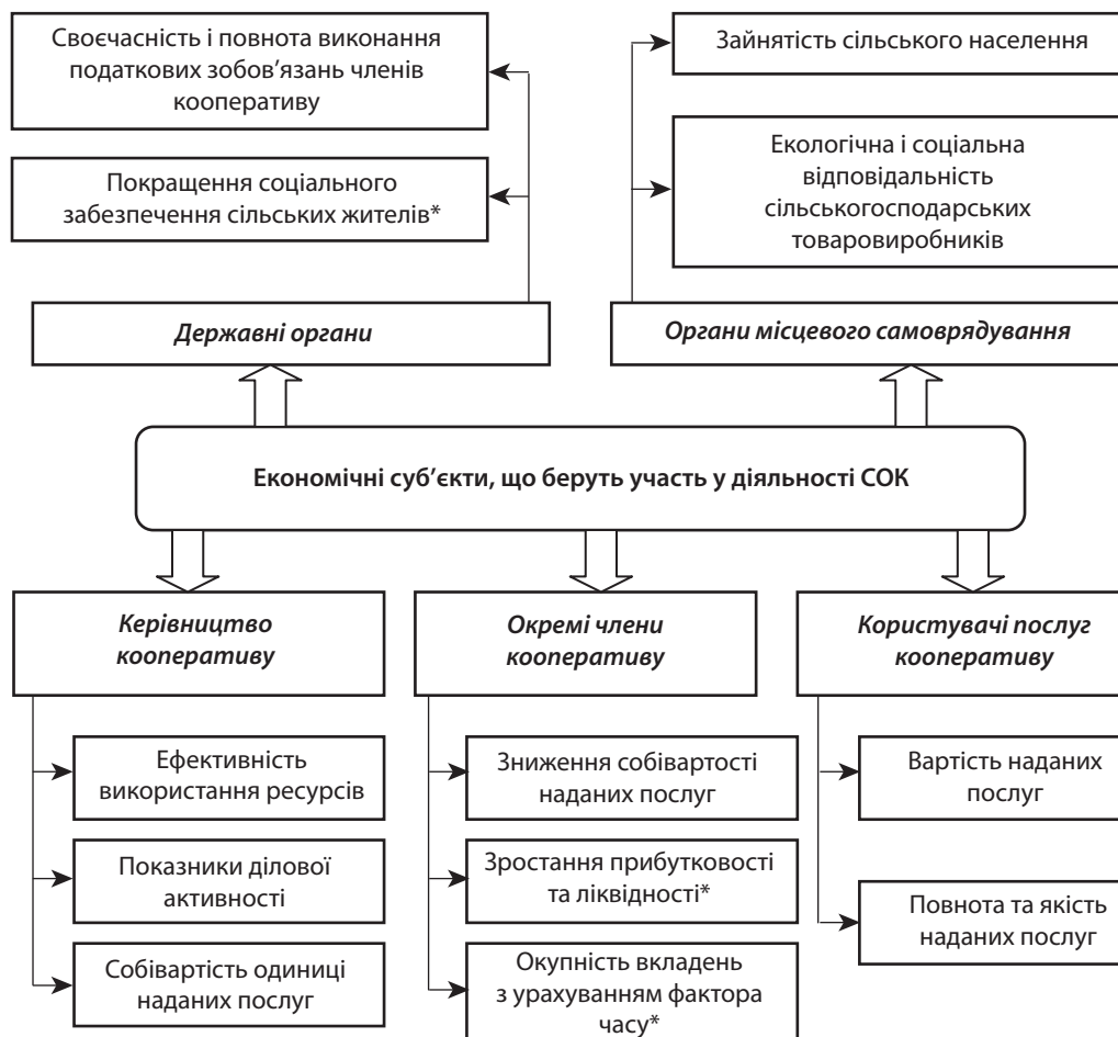
Рис. 3. Методика оцінювання ефективності функціонування обслуговуючого кооперативу в Криничанському районі [6]

Перспективами подальших досліджень у даному напрямі є створення багатофункціонального СОК у Криничанському районі Дніпропетровської області, що приведе до єдиного процесу виробництва сільськогосподарської продукції, її переробки та реалізації, сформується необхідна матеріально-технічна база, яка забезпечить комплексне використання ресурсів усього виробничого та економічного потенціалу сільськогосподарських підприємств. ■