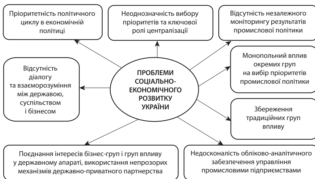
Рис. 1. Негативні моменти в соціально-економічному розвитку України

4. У розвитку післявоєнної ФРН важливу роль відіграв план Маршалла, тому що отримана за ним допомога йшла виключно на модернізацію економіки та впровадження нових технологій, що убезпечило Німеччину від можливості паразитування за рахунок кредитів. Одним з пріоритетних напрямків економічної політики