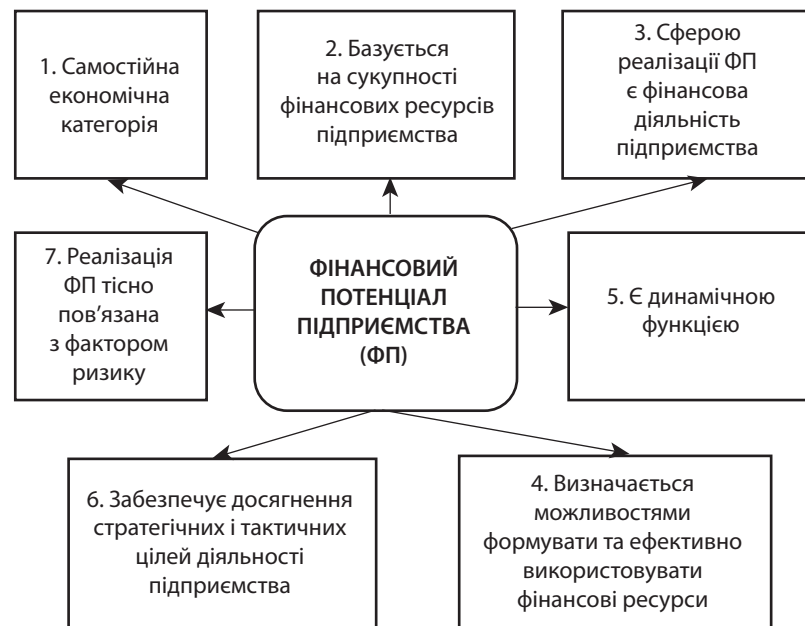
Рис. 2. Сутнісні характеристики фінансового потенціалу підприємства