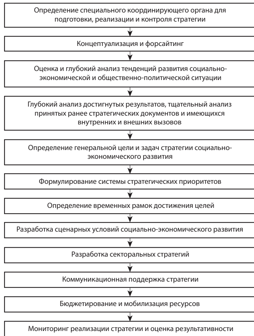
Рис. 2. Этапы формулирования стратегии социально-экономического развития стран мира [6; 7]

мо законодательно утвердить как основной плановый документ страны. Стратегия должна содержать несколько сценариев развития с учетом мировых тенденций и внутренних рисков. На основе Стратегии социально-экономического развития страны высшее руководство разрабатывает региональные стратегии развития на долгосрочную перспективу. Такие стратегии должны учитывать особенности развития регионов, их ресурсный потенциал, экономическое и социальное положение, место в экономической системе страны. На среднесрочном уровне стратегического планирования разрабатываются документы, которые детализируют долгосрочные в части определения заданий, ресурсной базы, ответственных исполнителей, критериев результативности [8; 9].