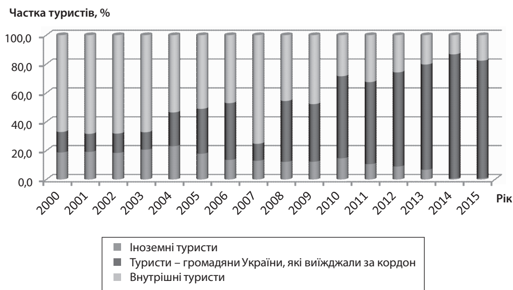
Рис. 3. Структура кількості туристів, що обслуговувалися суб'єктами туристичної діяльності України

Відповідним чином така ситуація позначилася на обсягах експорту-імпорту послуг (табл. 1). Зокрема обсяг експорту послуг, пов'язаних із подорожами, у 2014 р. порівняно з 2013 р. скоротився майже на 60%, а імпорту – лише на 2%. Обсяг експорту послуг приватним особам, культурних і рекреаційних послуг у 2014 р. скоротився на 20%, а імпорту – на 70%. У 2015 р. ситуація дещо стабілізувалася, лише обсяг експорту послуг приватним особам, культурних і рекреаційних послуг порівняно з 2014 р. зменшився ще на 50%. У загальній структурі імпорту послуг зростає частка послуг, пов'язаних із подорожами, і зменшилася частка послуг, наданих приватним особам, культурних і рекреаційних послуг. У структурі експорту послуг частка послуг, пов'язаних з подорожами, зменшилася на 1,5% і у 2015 р. уже становила 2,1%.