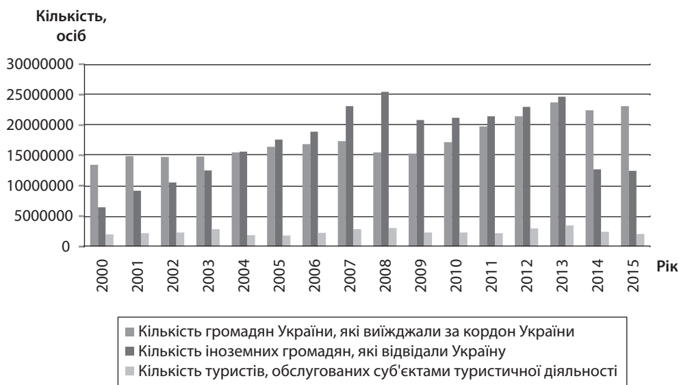
Рис. 1. Динаміка туристичних потоків

Скорочення кількості іноземних туристів негативно позначиться на розвитку готельно-туристичного бізнесу в Україні, адже вони є одним з каналів надхо-