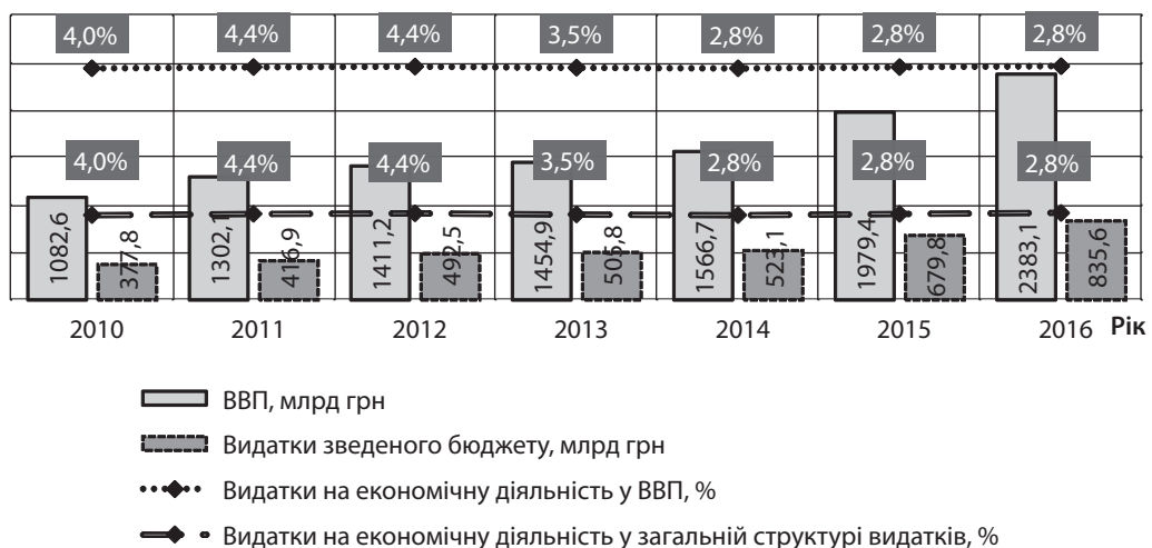
Рис. 1. Динаміка обсягу видатків зведеного бюджету на економічну діяльність та їх частки у ВВП протягом 2010–2016 рр., млрд грн/%

Зведений бюджет по видатках економічного характеру було виконано у 2016 р. – на 83,7%; у 2015 р. – 84,5%; у 2014 р. – 76,9%; у 2013 р. – 75,0%; у 2012 р. – 80,3%; у 2011 р. – 81,2%; у 2010 р. – 83,6%. Така тенденція