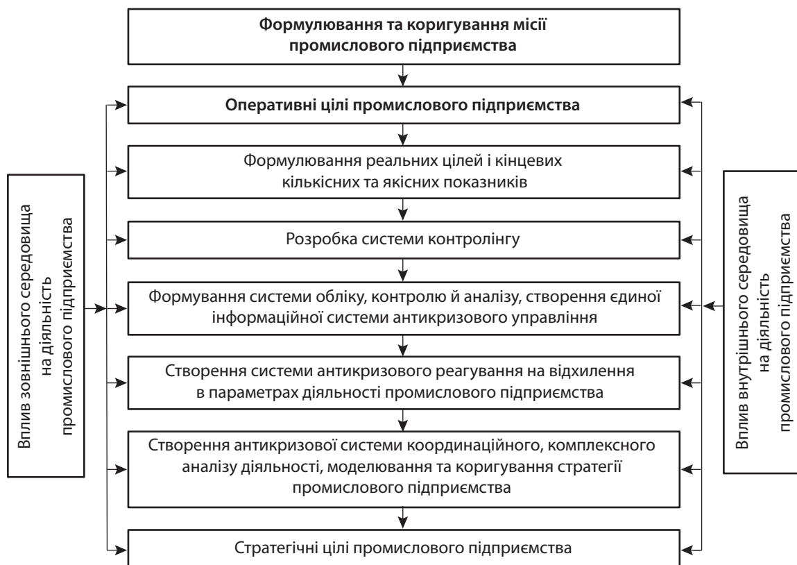
Рис. 1. Загальна схема модернізованої концепції контролінгу промислового підприємства

Концепція контролінгу є постійно змінною системою, що на теперішній час остаточно не сформувалася і знаходиться у стадії формування та пошуку. Особливість системи контролінгу полягає в тому, що він адаптується до підприємства, до його структури, місії, системи обліку, управління, потенційно впроваджуючись в них з метою їх удосконалення. Концепція контролінгу забезпечує ефективність прийняття антикризових управлінських рішень і сприяє оптимізації для досягнення цілей стратегії розвитку промислового підприємства (рис. 1).