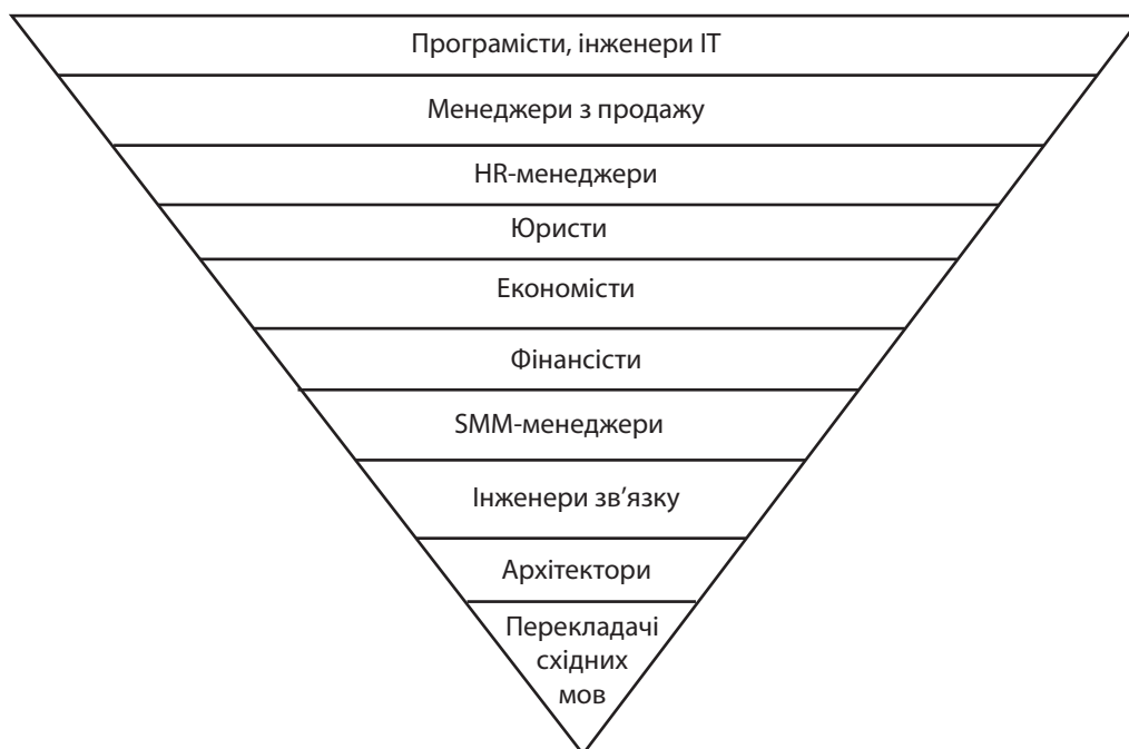
Рис. 2. Рейтинг найбільш затребуваних професій України у 2018 р.

Завдяки високим темпам розвитку інтернет-компанії менш чутливі до кризи. Наприклад, в Україні ринок електронної торгівлі – ледь не єдина галузь, яка продовжує зростати на 40% у рік, а в кризовий час – на 15–20%. При цьому більшість галузей української економіки у 2018 р. відзначають падіння продажу [11]. А значить, шанси втратити роботу у зв'язку із зовнішніми факторами набагато менші.