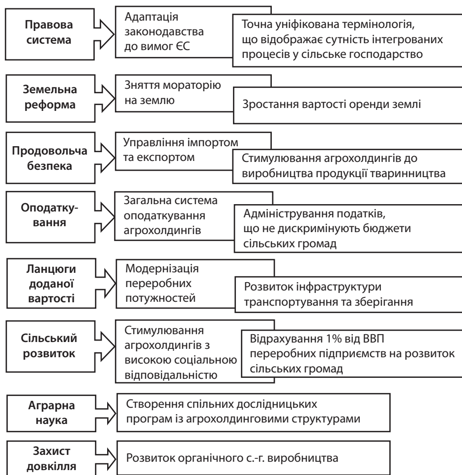
Рис. 2. Напрями регуляторних дій згідно зі стратегією розвитку

Якщо ж говорити про проблеми раціонального землекористування, то тут потрібний державний контроль за збереженням родючості ґрунтів. На думку окремих науковців, необхідно запровадити обов'язкову оцінку земельних ділянок за об'єктивними параметрами: вміст поживних речовин (азот, фосфор, калій) у рухомій формі, наявність залишків хімічних речовин у ґрунтах (пестициди, гербіциди, фунгіциди і т. ін.), ступінь еродованості та ін. Таку оцінку слід проводити при кожній зміні власника чи користувача земельної ділянки, а також 1 раз на 5–7 років (можливо, на час однієї ротації сівозміни) за відсутності таких змін. У разі погіршення показників порівняно з попередньою оцінкою власник (користувач) несе відповідальність: сплачує штрафи до бюджету або взагалі позбавляється права власності (користування) цією ділянкою. Таке покарання за порушення родючості ґрунтів спонукатиме суб'єктів