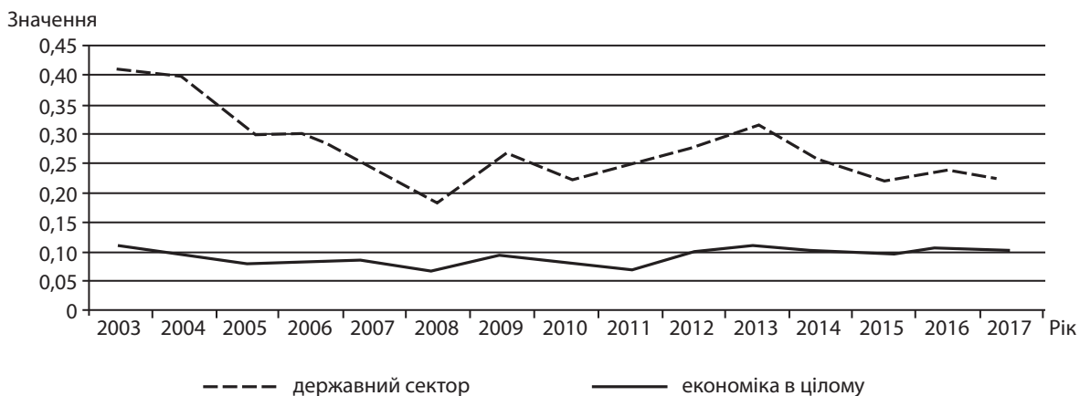
Рис. 1. Динаміка відношення споживання основного капіталу до проміжного споживання

с. 36], безпосередньо низхідні тенденції реалізуються з 2010 року (табл. 2). Менеджмент значної частки державних підприємств державної форми власності є непрозорим, важкоконтрольованим і неефективним [2, с. 43]. Показники випуску продукції, валової доданої вартості, валового прибутку, визначені в цінах 2017 року, мають поліноміальну залежність з рівнем достовірності 95 %. Екстремум – максимум для випуску продукції та валової доданої вартості спостерігається одночасно – у 2010 році. Виходячи з властивості контингентності економічних закономірностей можна висунути гіпотезу, що у 2010 році спостерігається злам тенденцій, перехід від висхідної тенденції до низхідної. Для валового прибутку за поліноміального типу тенденції її спрямованість є протилежною – у 2013 році відбувається зміна тенденції з низхідної до висхідної. Рівень невизначено-