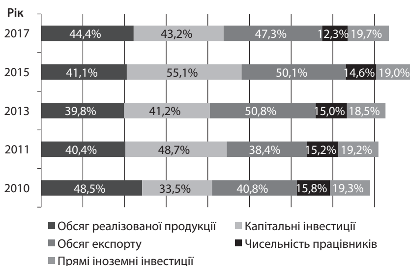
Рис. 2. Вклад підприємств харчової промисловості в загальнопромислові показники Херсонської області протягом 2010–2017 рр.

На рис. 2 видно, що на підприємствах харчової промисловості задіяно значну кількість працівників. У 2017 р. чисельність найманих працівників становила 12,7 тис. осіб (12,3% від загальної чисельності у промисловості). Протягом аналізованого періоду