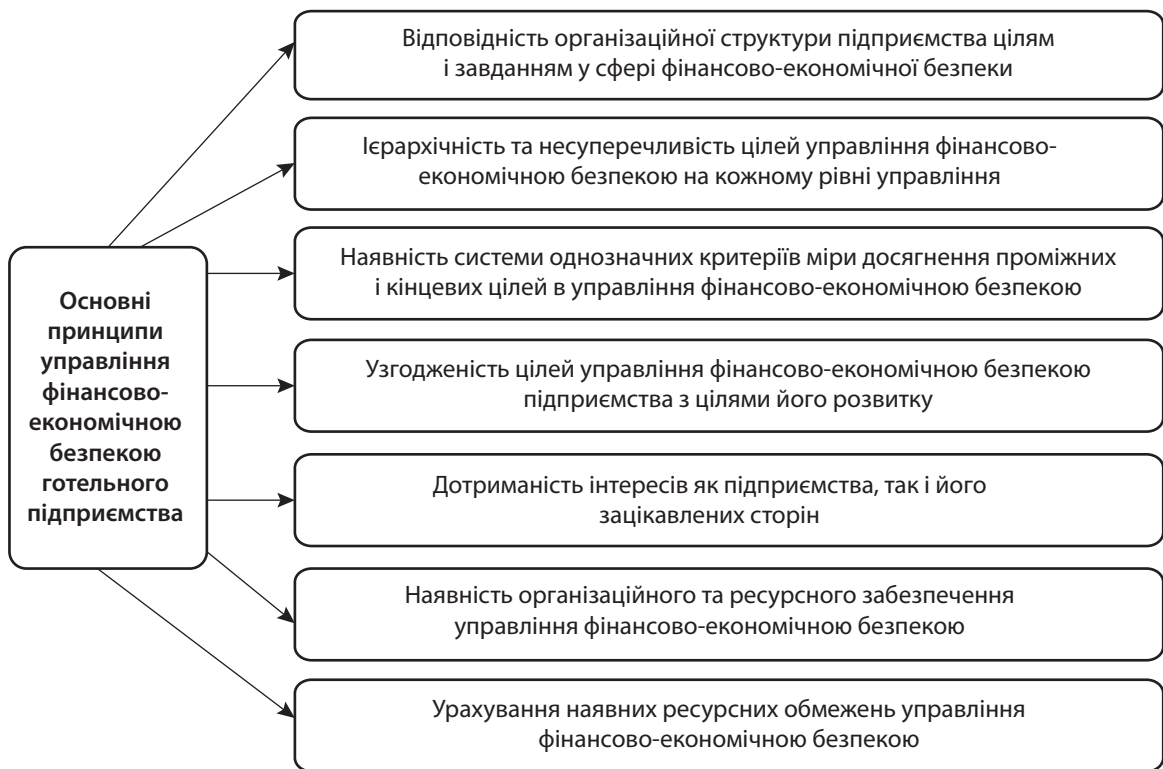
Рис. 3. Основні принципи управління фінансово-економічною безпекою готельного підприємства