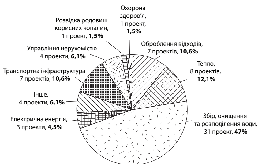
Рис. 2. Структура та кількість проектів державно-приватного партнерства в Україні за сферами господарської діяльності