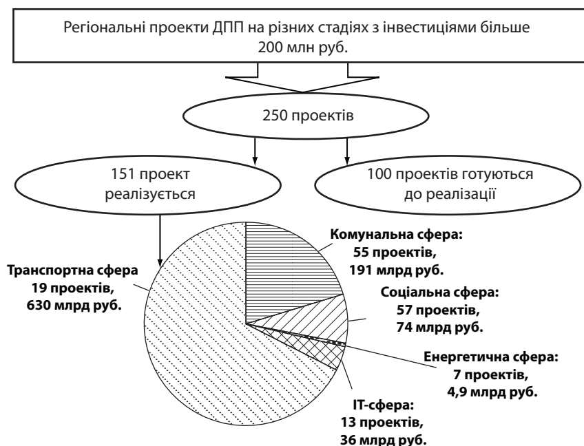
Рис. 3. Регіональні проекти ДПП в ЄАЕС станом на третій квартал 2016 р.

Уточнення сутнісно-класифікаційних ознак, методологічного підґрунтя державно-приватного партнерства та поступове удосконалення аналітичного інструментарію у цій сфері сприятиме більш широкому й усвідомленому налагодженню взаємовідносин у сфері ДПП в Україні. Створена на принципах соціальної відповідальності й інвестиційно-інноваційного розвитку аналітична та рекомендаційна база дозволить сформувати комплексне бачення подальшої співпраці державного та приватного секторів української економіки. Це, своєю чергою, позитивно вплине на прийняття управлінських рішень, спрямованих на: покращення економічних, соціальних та екологічних параметрів функціонування державних підприємств з мінімізацією всіх видів ризиків; запобігання помилкам, здійсненим у минулих періодах, що впливають на діяльність державних установ; формування тактичних і стратегічних векторів розвитку суб'єктів бюджетного сектора націо-