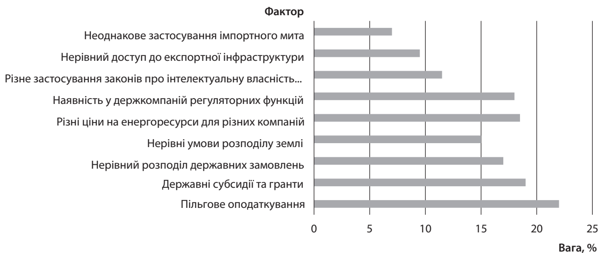
Рис. 1. Фактори нерівності в конкуренції за результатами опитування на вітчизняних підприємствах

Конкурентна політика України здійснюється завдяки комплексу інструментів: правила попередження, обмеження, а в деяких випадках навіть припинення недобросовісної діяльності конкурентів, правові норми захисту конкуренції та контролю за концентрацією підприємств у галузі та регулювання діяльності природних монополій. У законі України «Про Антимонопольний комітет України» (1993) визначено види монополій, їх межі, повноваження та завдання АМКУ у формуванні та реалізації конкурентної політики.