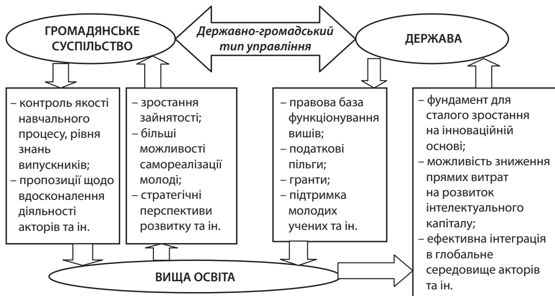
Рис. 1. Точки перетину інтересів громадянського суспільства, держави та сфери вищої освіти