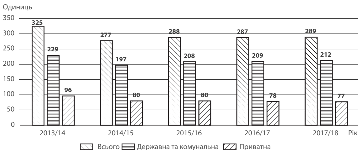
Рис. 2. Кількість ЗВО України III–IV рівнів акредитації за формами власності станом на початок відповідного навчального року, од.