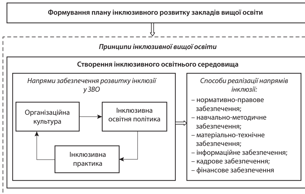
Рис. 2. Формування плану інклюзивного розвитку закладів вищої освіти