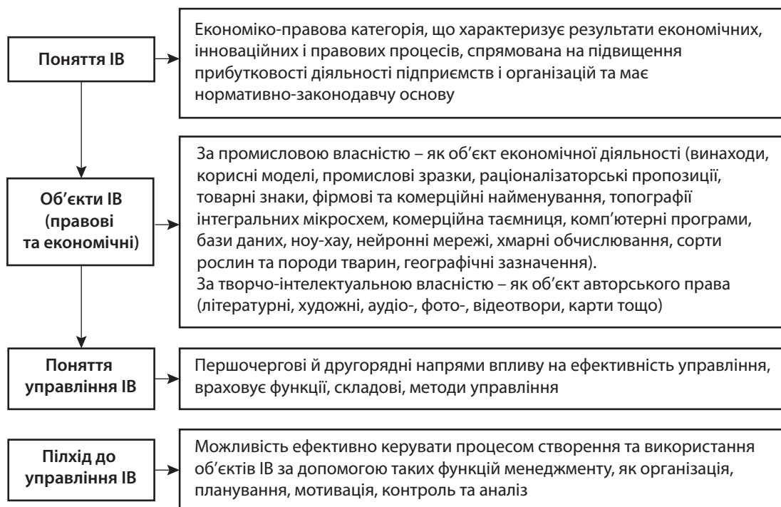
Рис. 2. Теоретичний базис управління ІВ промислових підприємств