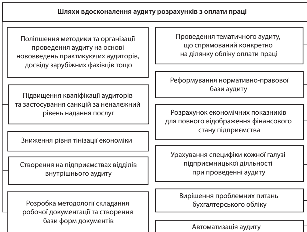
Рис. 2. Шляхи вдосконалення аудиту розрахунків з оплати праці

6. Новік К. П. Проблеми підвищення якості аудиторської діяльності // Збірник матеріалів III Всеукраїнської науково-практичної конференції «Сучасні проблеми обліку, аналізу, аудиту й оподаткування суб'єктів господарської