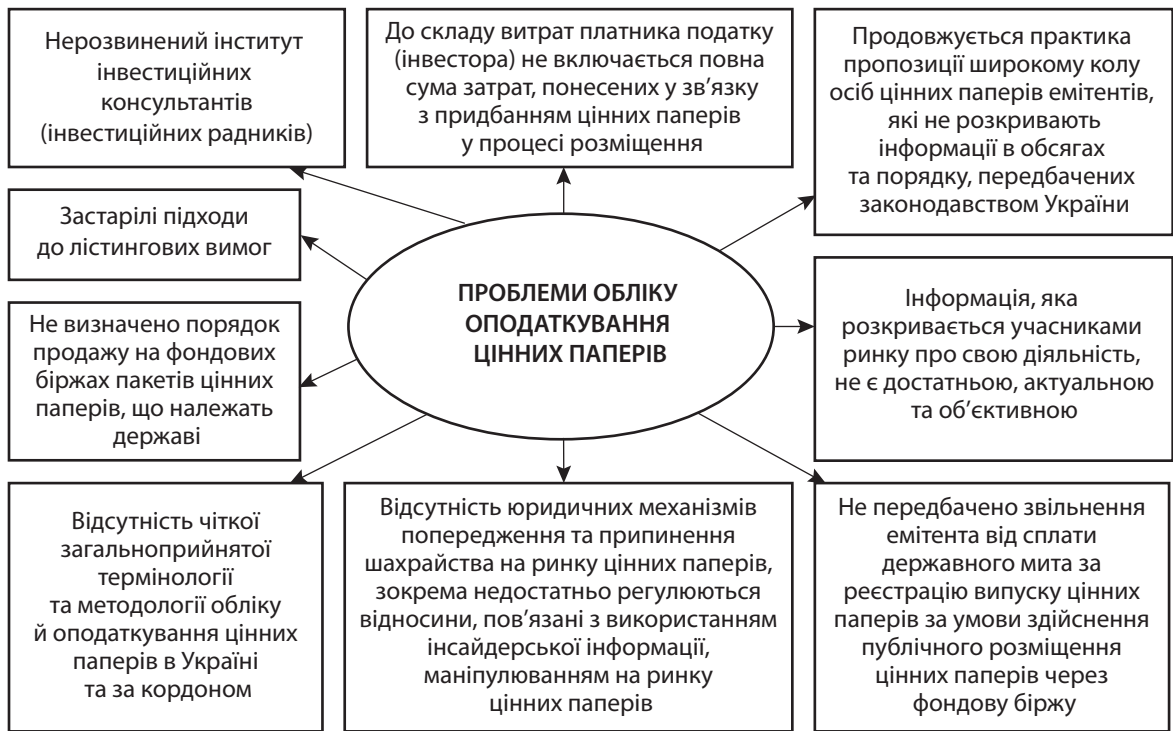
Рис. 3. Проблеми обліку та оподаткування операцій з цінними паперами в Україні