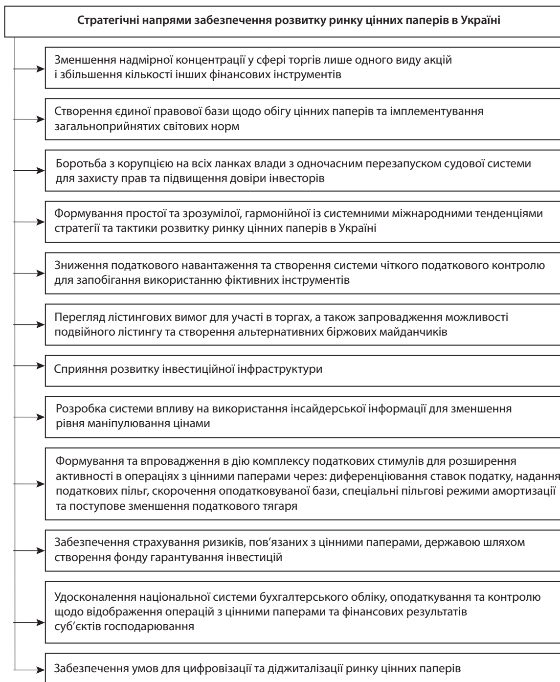
Рис. 2. Стратегічні напрями забезпечення розвитку обігу цінних паперів в Україні