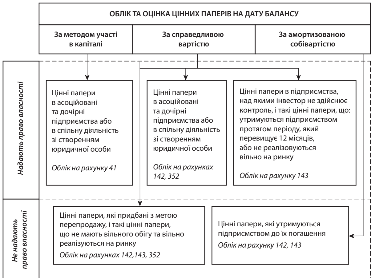
Рис. 4. Систематизований порядок обліку та оцінки цінних паперів на дату балансу