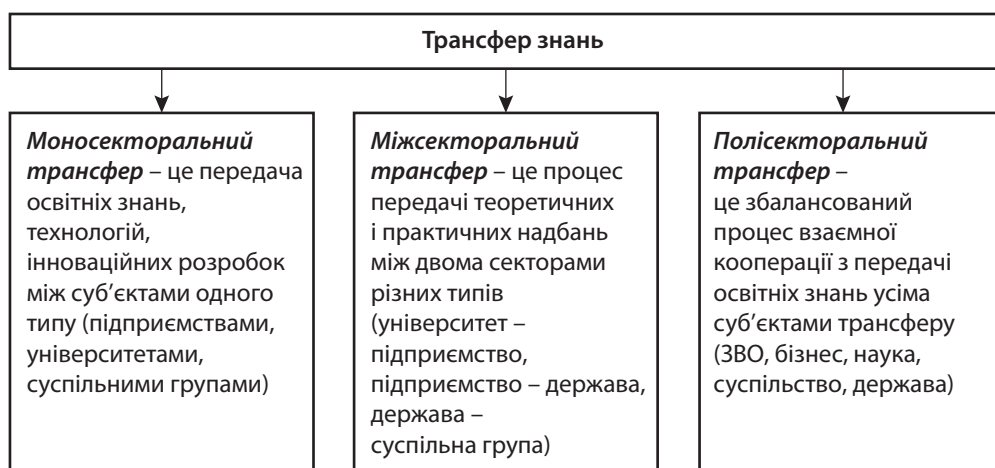
Рис. 2. Класифікація трансферу знань