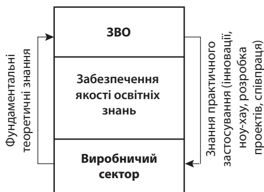
Рис. 1. Цикл передачі якісних знань між ЗВО і виробничим сектором

освітніми та науковими центрами через їх трансфер у виробничий сектор, що показано на рис. 1 .