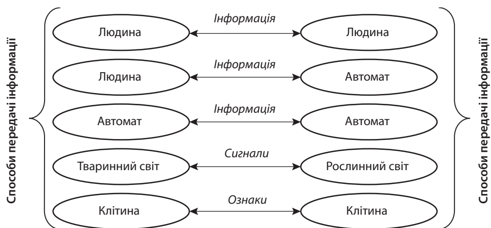
Рис. 2. Способи передачі інформаційних ресурсів

Інформаційні ресурси можуть бути представлені в різних формах – як в електронній, так і в неелектронній, однак у процесі розвитку комунікаційних систем та Інтернету все більшу перевагу віддають електронній інформації, створюючи при цьому інформаційну базу ресурсів.