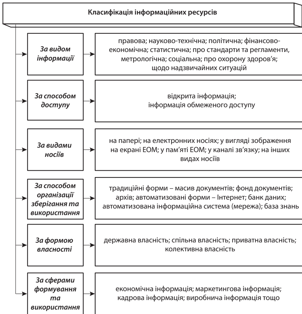
Рис. 3. Класифікація інформаційних ресурсів