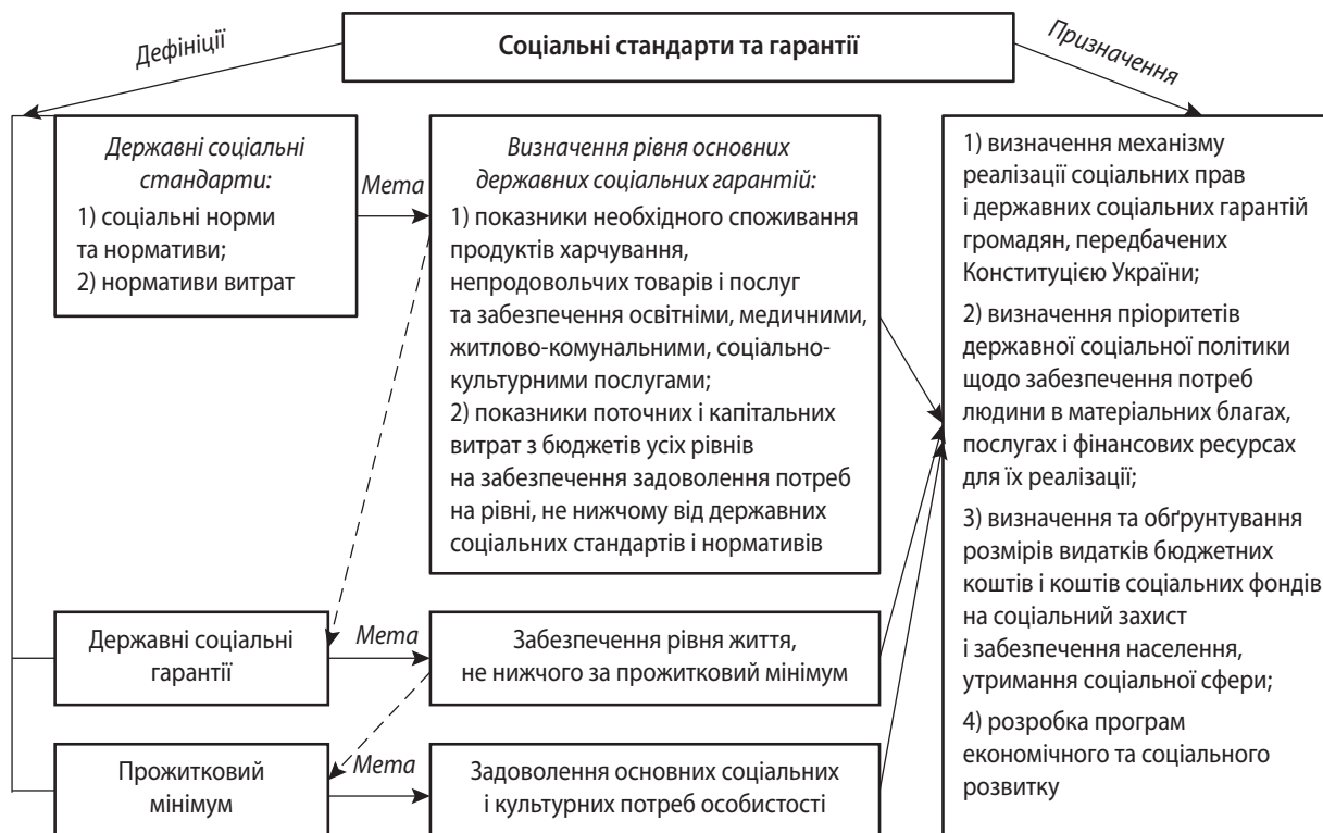
Рис. 2. Структура державних соціальних стандартів і державних соціальних гарантій