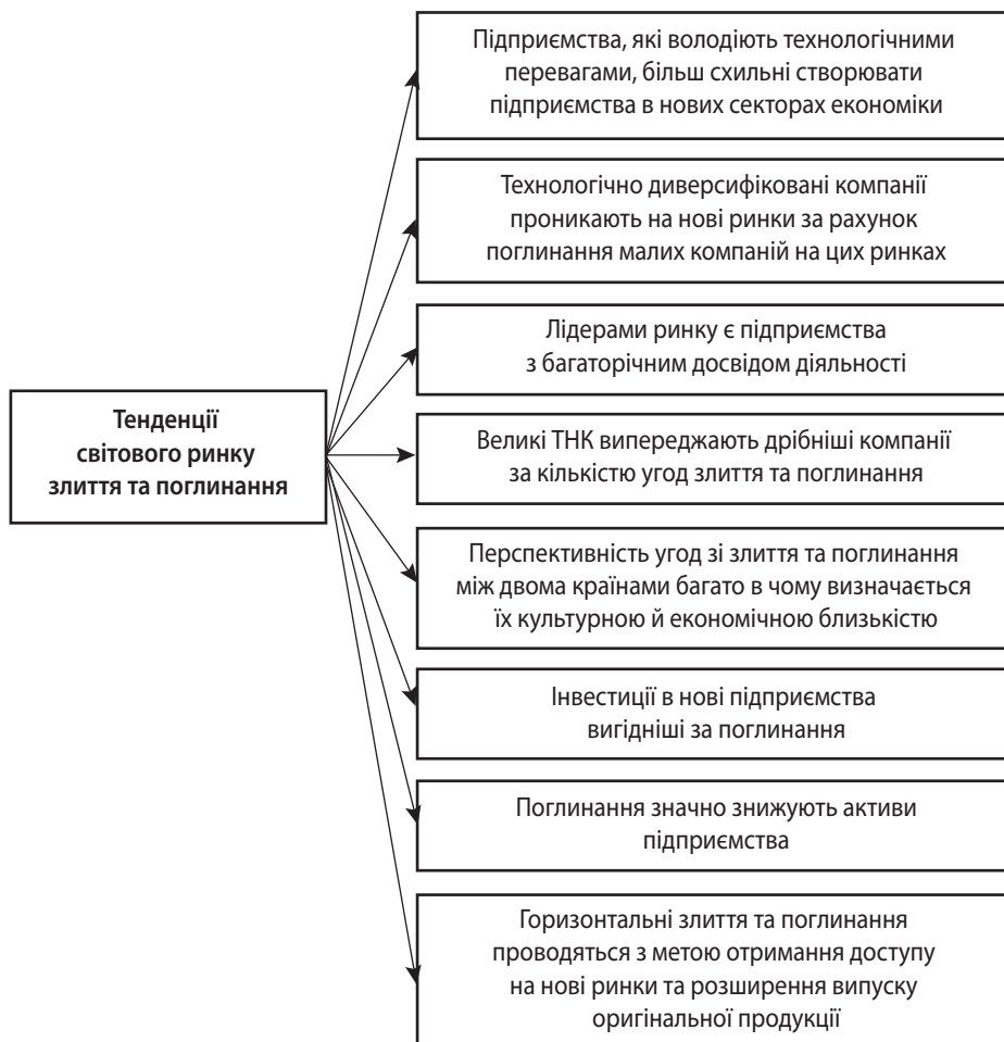
Рис. 1. Тенденції світового ринку злиття та поглинання