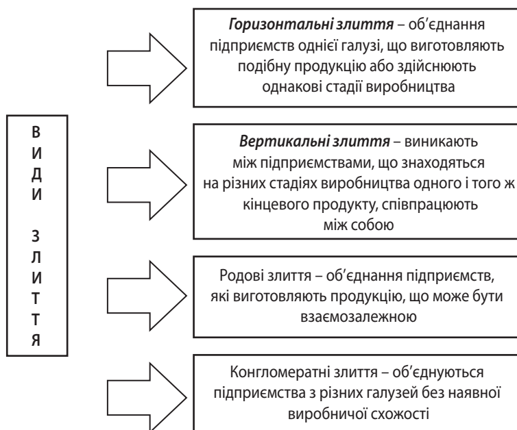
Рис. 2. Види злиття