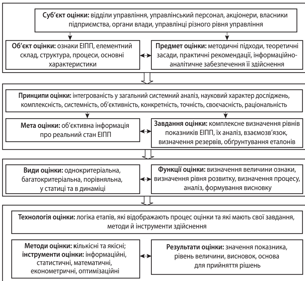
Рис. 2. Методологічний каркас оцінки експортно-імпортного потенціалу підприємства

положення. Дане теоретичне положення частково впливає з попереднього. Ефективність використання експортно-імпортного потенціалу підприємства визначається багатьма елементарними та складними ознаками, які, своєю чергою, вимірюються частинними та інтегральними показниками. Оцінка ефективності використання експортно-імпортного потенціалу здійснюється за багатьма критеріями, які залежать від місії, цілей, стратегій підприємства. Одним із основних критеріїв є випереджаючі темпи зростання обсягів експорту над імпортом, що забезпечує ефективність експортно-імпортової діяльності, всієї діяльності та розвиток підприємства.