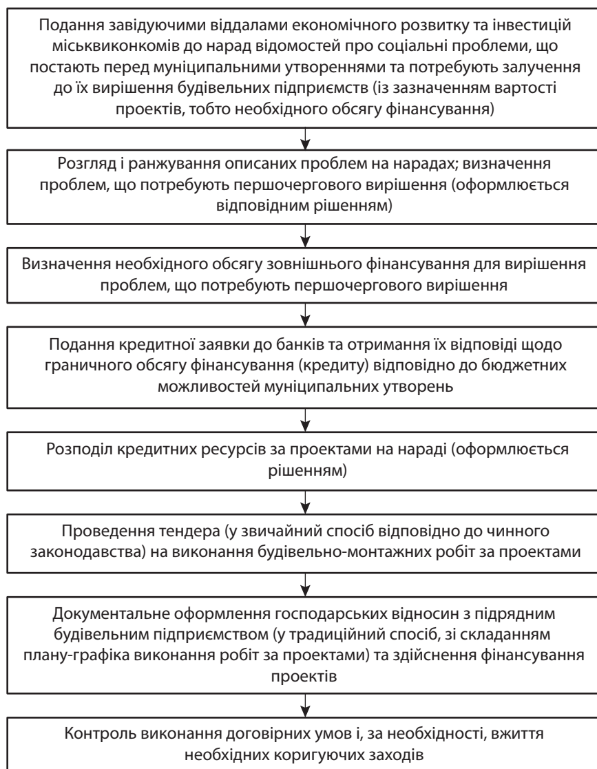
Рис. 2. Пропонований алгоритм прийняття рішень щодо реалізації соціально значущих проектів із залученням будівельних підприємств регіону