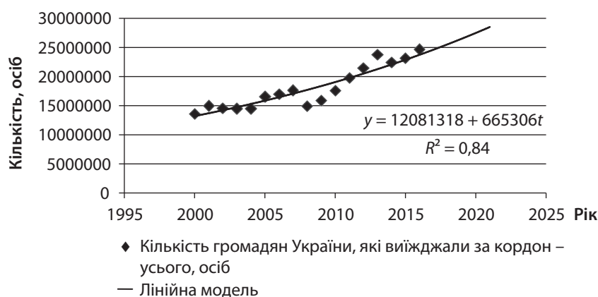
Рис. 2. Лінійна модель тренду кількості громадян України, які виїжджали за кордон у 2000–2017 рр.