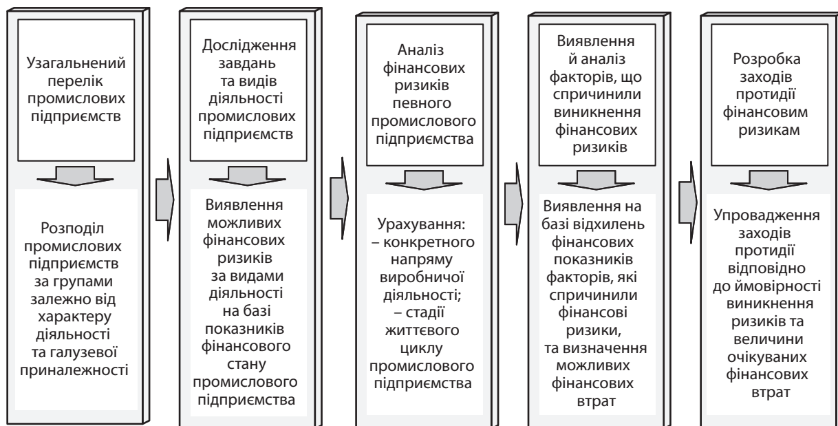
Рис. 4. Схема формування заходів протидії фінансовим ризикам

Виявлення факторів, що зумовлюють негативні відхилення показників, дозволяє визначити першопричини їх виникнення та розробити адекватні заходи щодо їх усунення або мінімізації. За відсутності постійного моніторингу значень означених показників та контролю зазначених відхилень підприємство не зможе своєчасно розробити адекватні дії, спрямовані на мінімізацію фінансових втрат, які є результатами прояву тих чи інших видів фінансових ризиків. Факторами, що спричиняють ризики фінансових втрат, можуть бути: специфічні для окремого підприємства збої параметрів технологічного процесу; високий ступінь зносу обладнан-