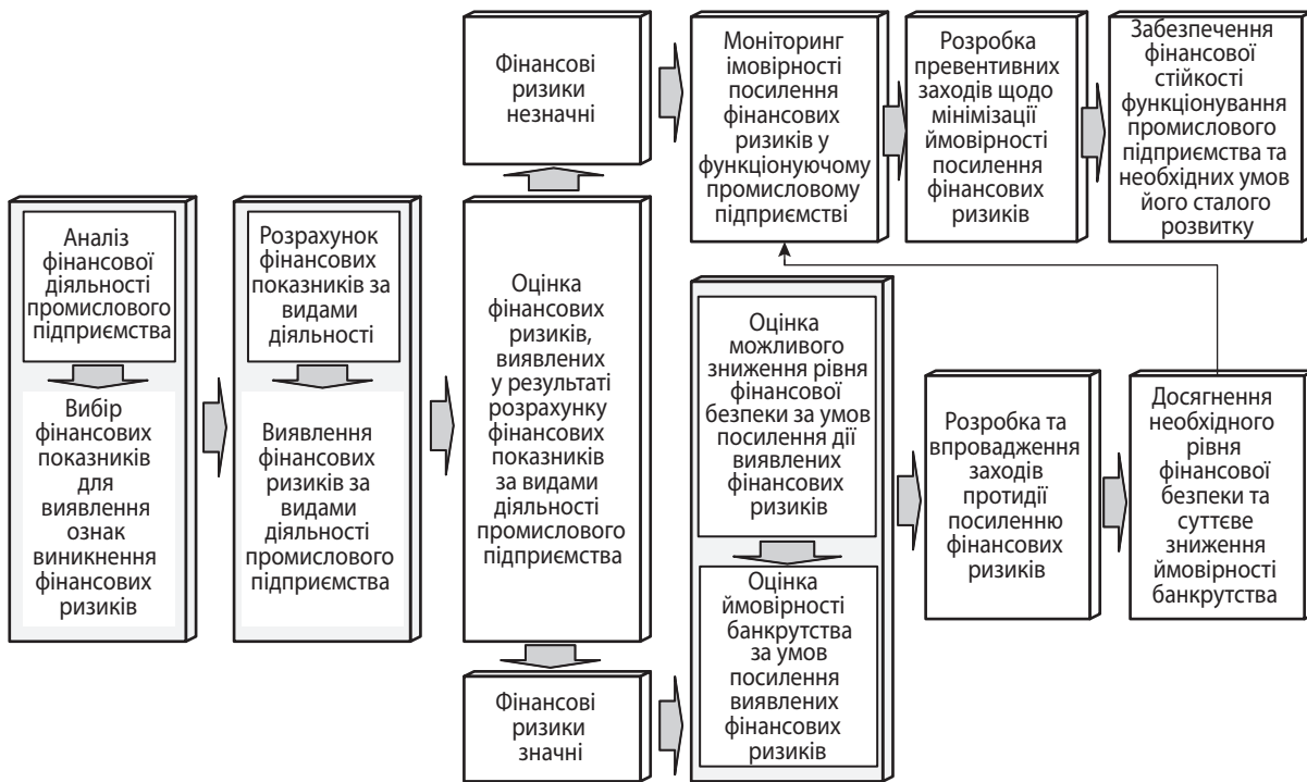
Рис. 2. Схема підтримки фінансової стабільності підприємства