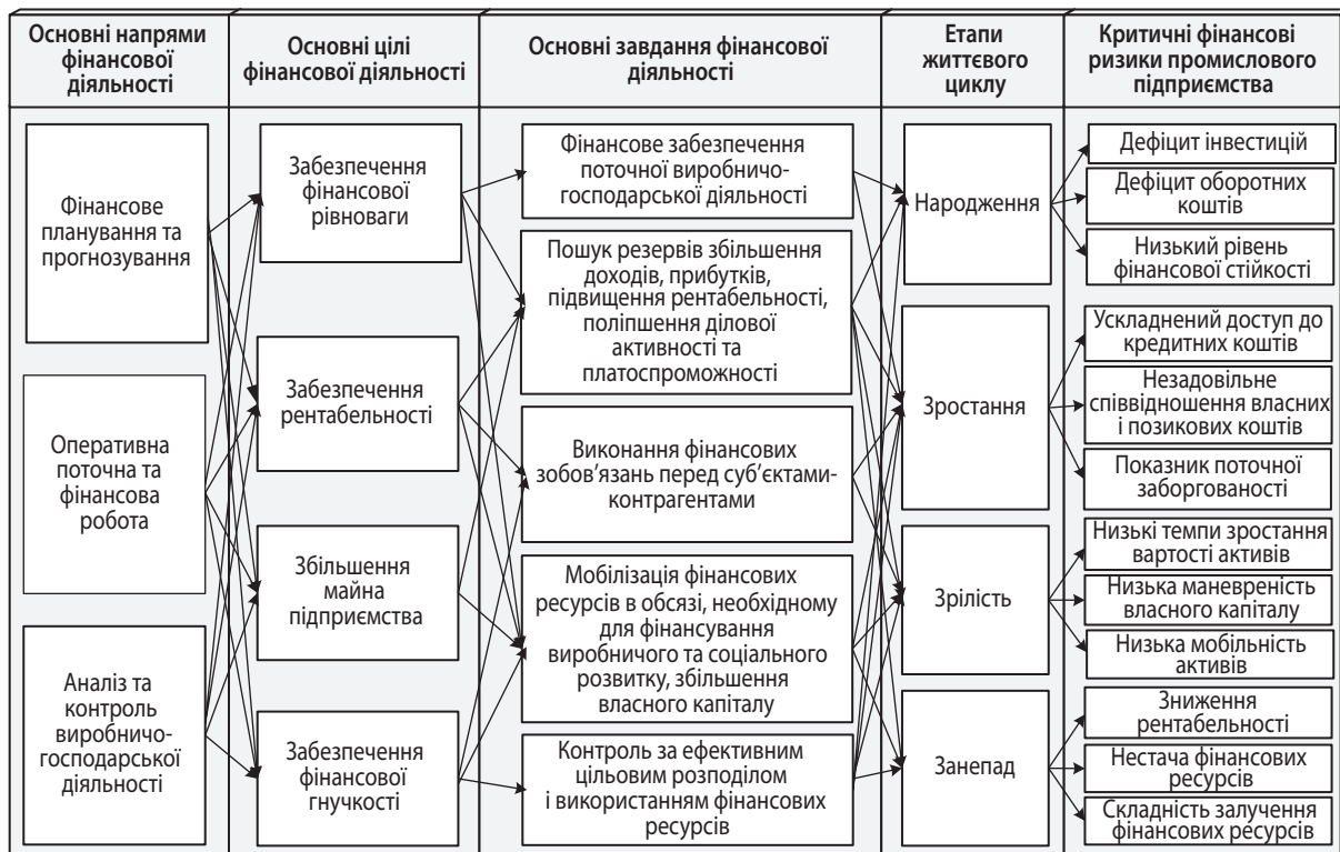
Рис. 5. Напрями, цілі та завдання фінансової діяльності та критичні фінансові ризики на етапах життєвого циклу промислового підприємства