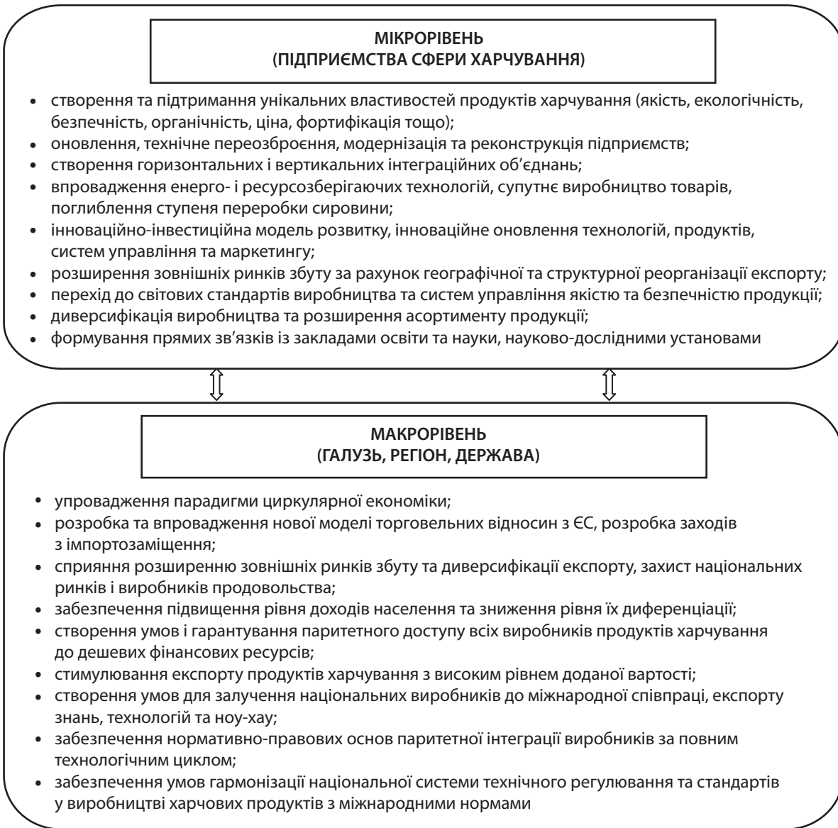
Рис. 2. Система заходів сталого розвитку підприємств сфери харчування