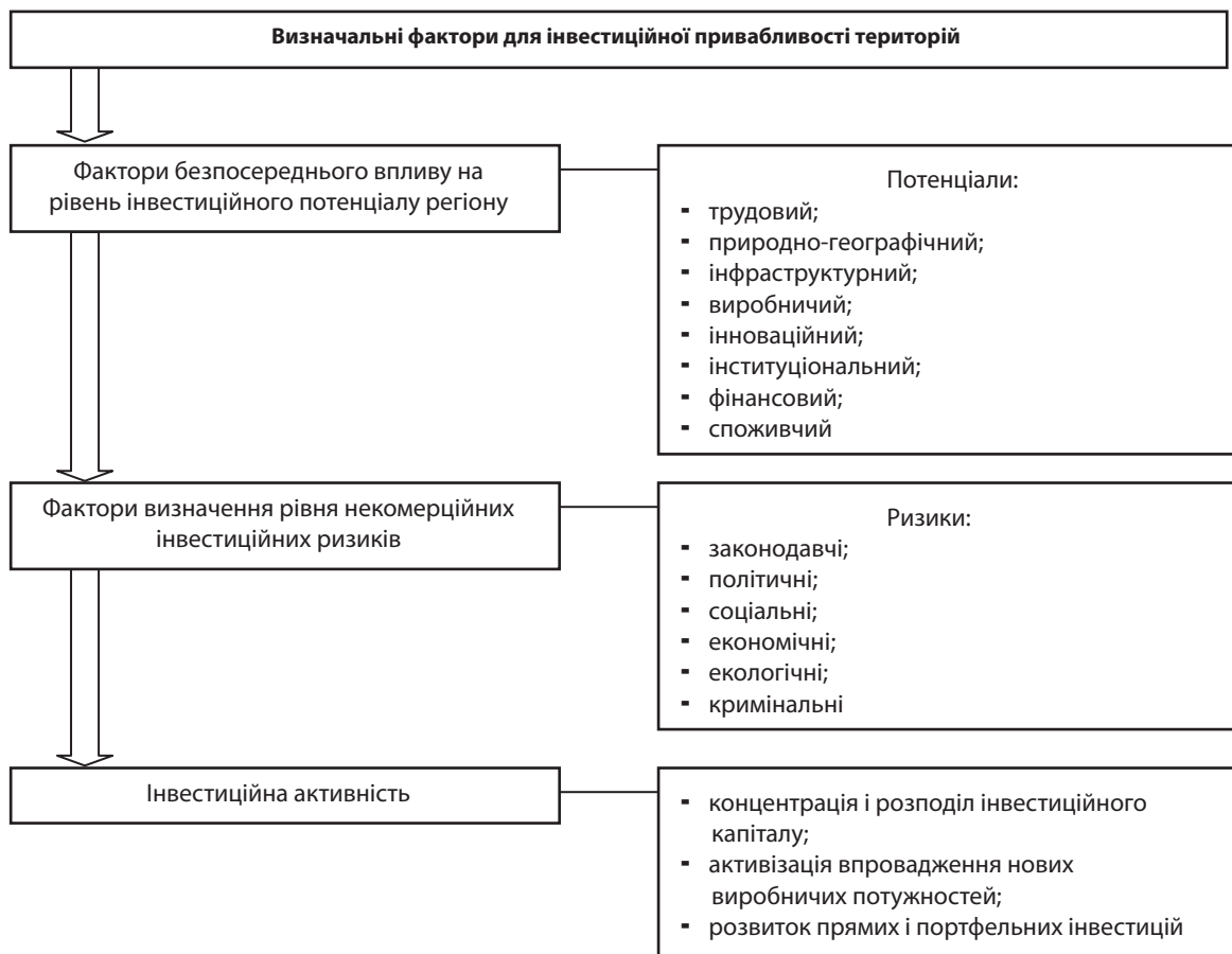
Рис. 1. Фактори інвестиційної привабливості територій

Аналізуючи стан, у якому знаходиться країна чи регіон, інвестори повинні передбачити всі можливі втрати, оцінити перешкоди у здійсненні капіталовкладень, а також створенні та веденні бізнесу, що призводять до відмови від розвитку підприємництва в регіоні. Перша й основна умова, яка є обов'язковою для кожного інвестора, – це захищеність інвестиційного капіталу. На жаль, Україна не може надати гарантію захисту інвестицій, саме тому іноземні інвестори і не хочуть ризикувати та вкладати свої кошти в нестабільну українську економіку. Для активізації