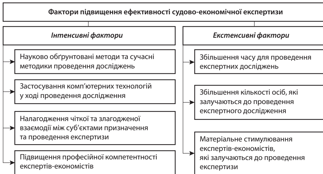
Рис. 1. Фактори підвищення ефективності судово-економічної експертизи