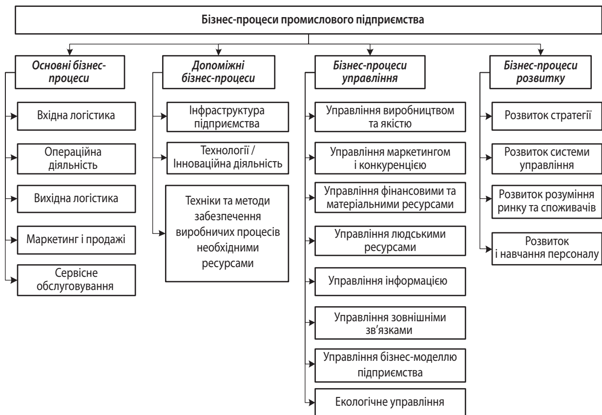
Рис. 2. Бізнес-процеси промислових підприємств