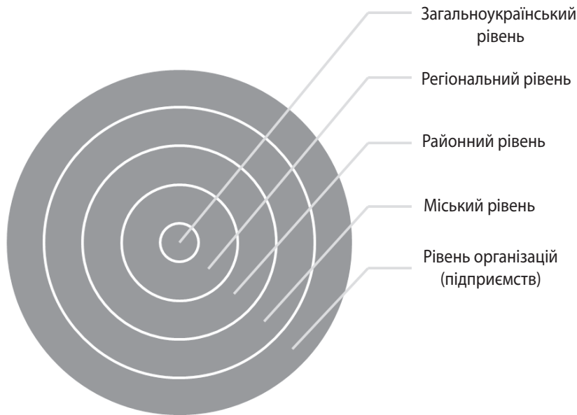
Рис. 1. Рівні систем у туристично-рекреаційному бізнесі

ційних послуг, що, своєю чергою, зводиться до виявлення основних завдань у туристично-рекреаційному бізнесі: формування та подальший розвиток туристичних і рекреаційних комплексів на території України; просування туристично-рекреаційного продукту України на міжнародному та регіональному туристичних ринках, а також проведення заходів щодо підвищення якості обслуговування туристично-рекреаційного бізнесу.