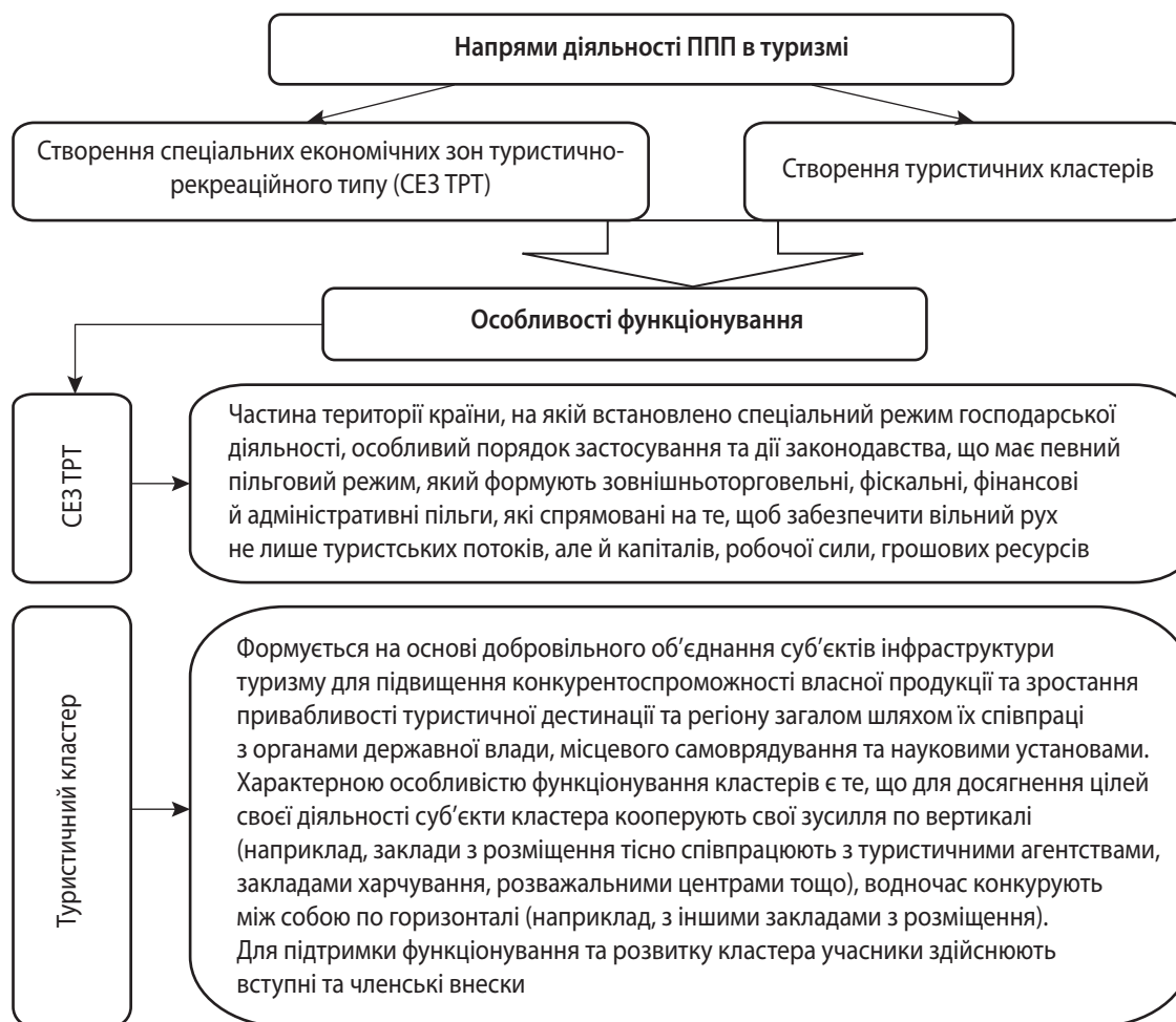
Рис. 2. Основні напрями діяльності ППП у туризмі