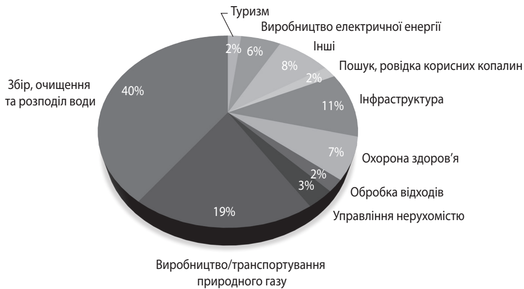
Рис. 3. Розподіл угод ППП за сферами економіки