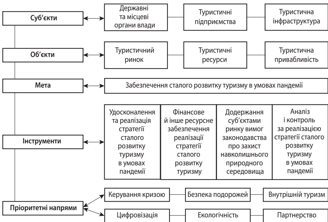
Рис. 3. Механізм управління сталим розвитком туризму в умовах пандемії

Ураховуючи нові обставини, необхідно внести відповідні зміни до запропонованого в Дорожній карті [1] плану дій на 2020–2021 рр. і включити до них негайні заходи з реагування на кризу